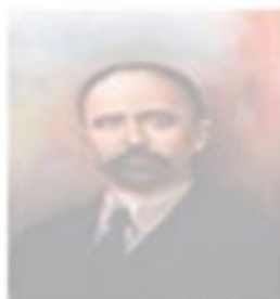
FRANCISCO I. MADERO